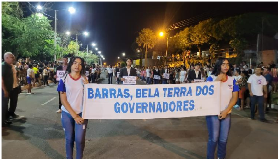
Fonte: Apresentação da Escola Municipal Raimundo Nonato Cardoso no desfile cívico de Barras (2023) Acervo: Maura Fabrícia S. de Almeida

É importante refletir se esse título representa toda a população barrense, se todos os moradores de Barras se identificam e se sentem representados por essa memória. Será se podemos atribuir o título “Terra dos poetas e governadores” como identidade do povo barrense?