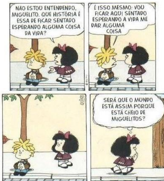
Tirinha da Mafalda

Análise da Tirinha da Mafalda com foco na coletividade ativa e os movimentos sociais.