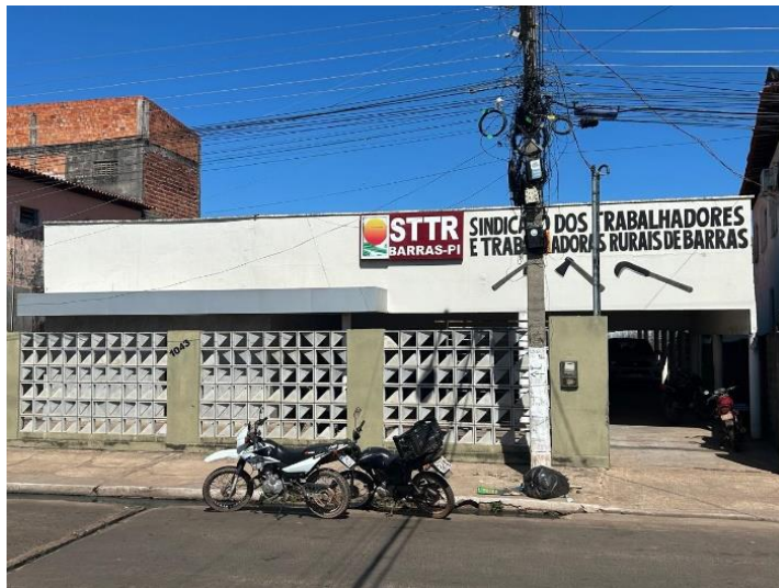
Imagem 03: Fachada do prédio do STTRB