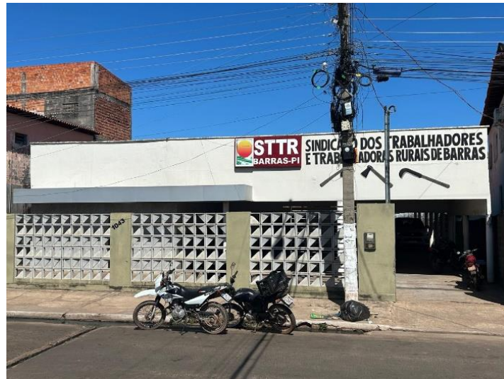
Fachada do prédio do STTRB