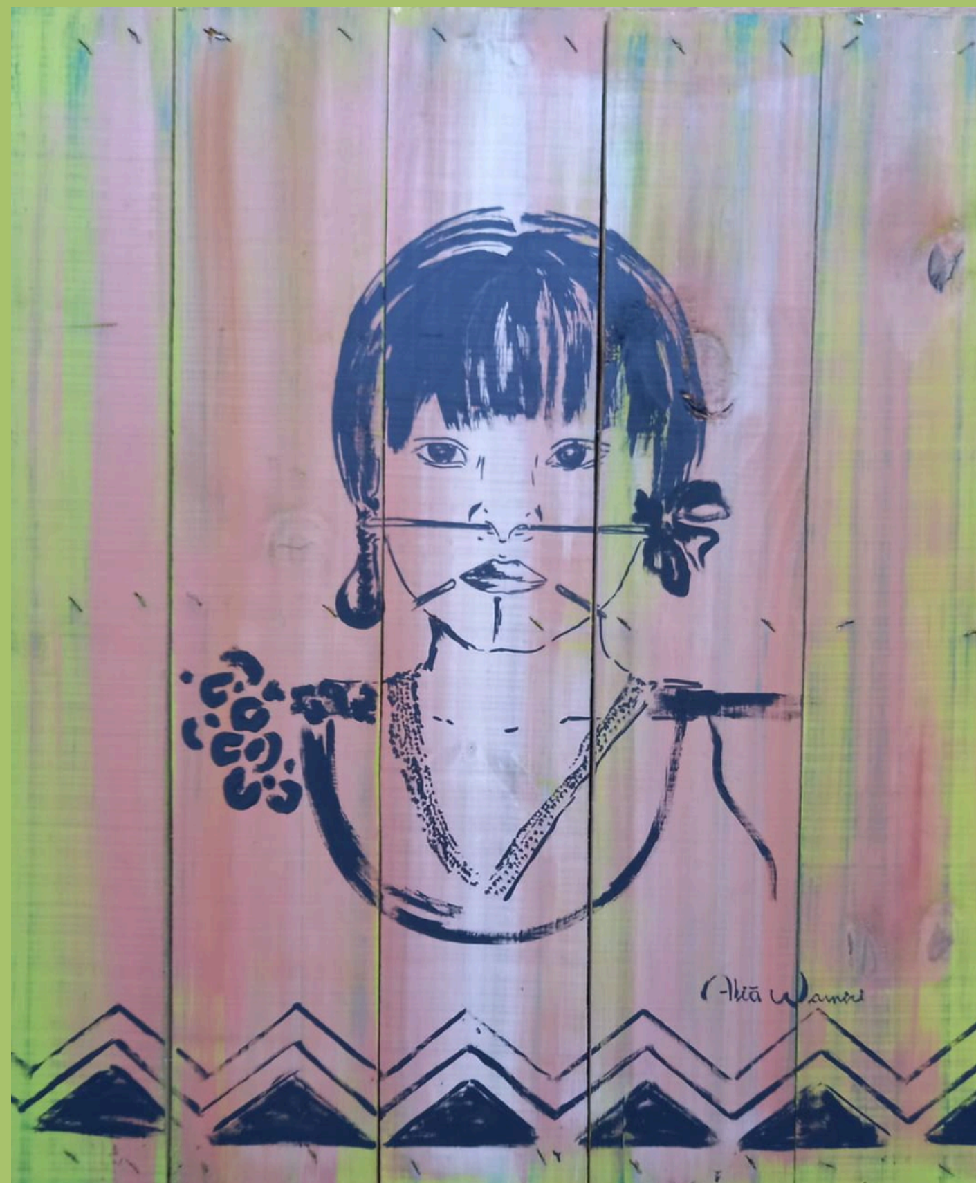
SÉRIE UKAIR 2019-2022

ACERVO DA EXPOSIÇÃO "Pés na aldeia, coração no mundo. Sesc SP