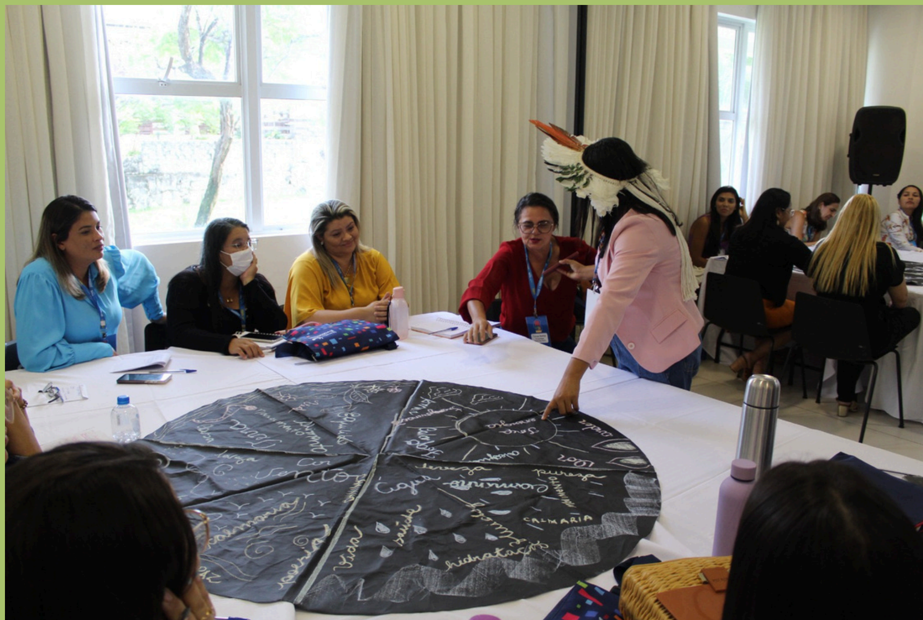
IVJORNADA PEDAGÓGICA DA ESCOLA SESC-RN Prática Educativa