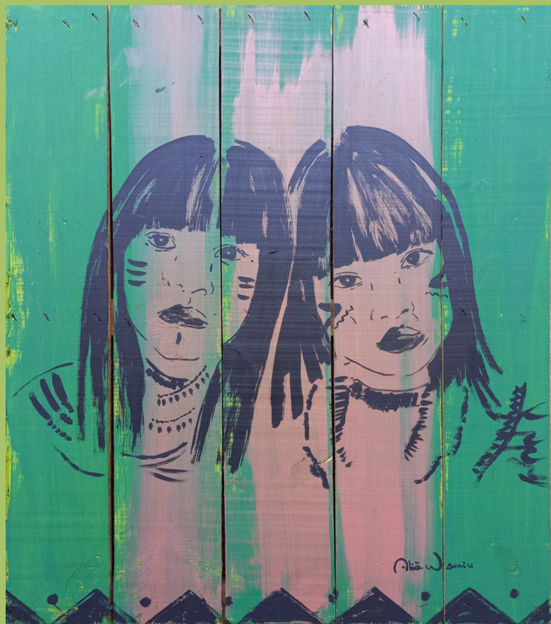
SÉRIE UKAIR 2019-2022

ACERVO DA EXPOSIÇÃO "Pés na aldeia, coração no mundo. Sesc SP