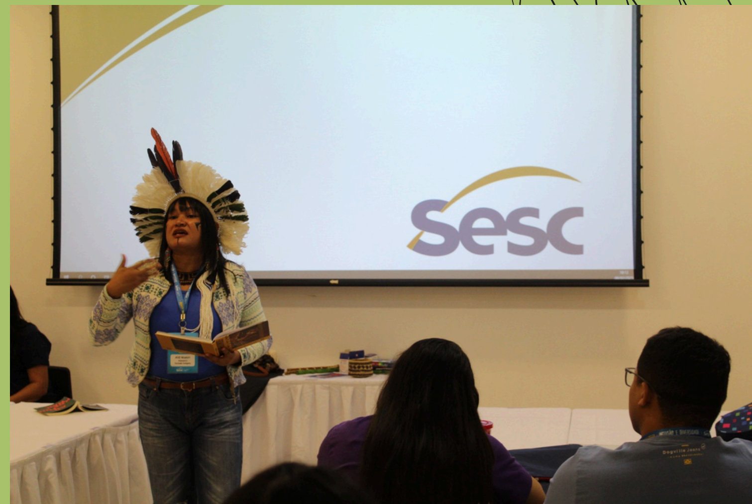
IVJORNADA PEDAGÓGICA DA ESCOLA SESC-RN Atividade educativa