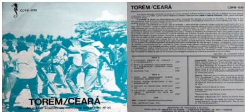
Imagem 1: Capa e contracapa do Doc. Sonoro sobre o torém/Ceará (1979)

Esses primeiros tópicos foram construídos apenas com o objetivo de situar o leitor/professor acerca da dinâmica histórica que envolve tanto os Tremembé quanto a dança do torém. Mais precisamente, foi a partir da década de 1980 que essa prática passou a ser reelaborada e utilizada como elemento diferenciador, aglutinador e legitimador do grupo em torno de uma concepção étnica indígena Tremembé, contribuindo assim para dar maior visibilidade às lutas por reconhecimento e pela demarcação territorial.