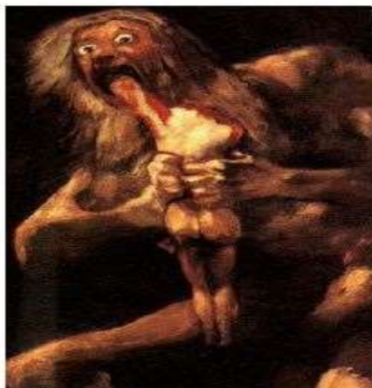
Imagem 3: “Saturno devorando um filho” 1819-1823. Francisco de Goya (1746-1828). Museu do Prado Madrid

Como vemos na representação feita em pintura por Francisco de Goya, o tempo age no sentido de fazer esquecer o passado, engolindo-o como se tivesse que se livrar de um fardo ou um futuro ameaçador. Com a memória indígena ocorreu algo semelhante quando não só sua história foi negada como também sua própria existência atual. Por outro lado, narrativas artísticas como a escultura “Clio e Cronos” no Mosteiro de Wiblingen, na Alemanha, dão conta das relações entre a história e o tempo, descritas por Paul Ricoeur da seguinte maneira: