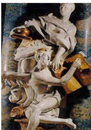
Imagem 4: Estátua da Biblioteca do Mosteiro de Wiblingen em Ulm, na Alemanha.

“Num lugar escolhido da biblioteca do mosteiro ergue-se magnífica escultura barroca. É figura dupla da história. Na frente, Cronos, o deus alado. É um ancião com a fronte cingida; a mão esquerda segura um imenso livro do qual a direita tenta arrancar uma folha. Atrás, e em desaprumo, a própria história. O olhar é sério e perscrutador; um pé derruba uma cornucópia de onde escorre uma chuva de ouro e prata, sinal de instabilidade; a mão esquerda detém o gesto do deus, enquanto a direita exhibe os instrumentos da história: o livro, o tinteiro e o estilo” (RICOEUR, 2007 p, 33).