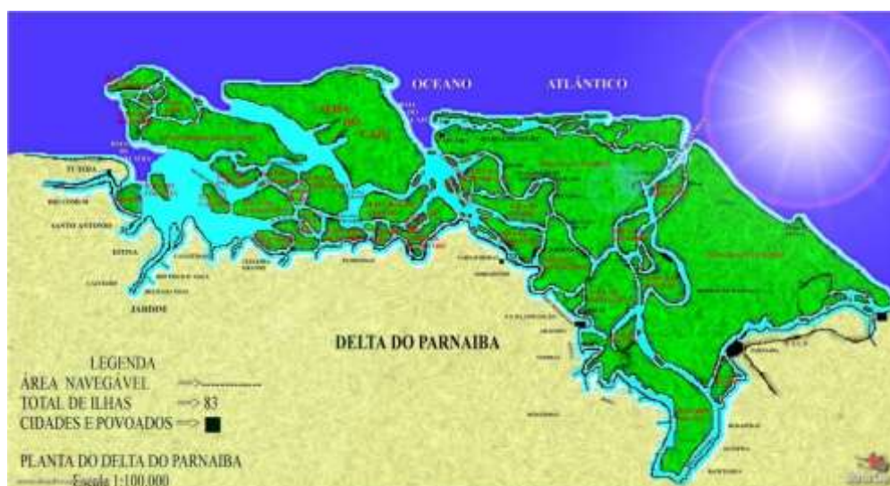
Mapa 2: Planta do Delta do Parnaíba enviado aos alunos como ilustração.

O trabalho com esse tipo de informação histórica possibilitou aos alunos uma descrição parcial do contexto colonial e, sobretudo de ações indígenas Tremembé na região do Delta, onde reside a grande maioria dos alunos da escola. Além desses trechos selecionados, existem muitos outros que também poderiam ser trabalhados para discutir a História dos Tremembé no Delta do Parnaíba, entretanto, para os objetivos de contextualização histórica visando o trabalho focado na música indígena, os textos que trouxemos aqui foram suficientes para os objetivos propostos.