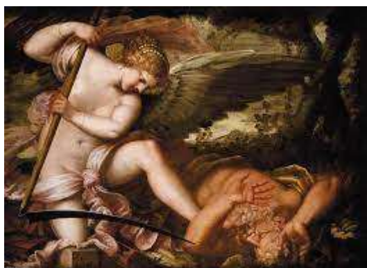
Imagem 5: Pietro Liberi (1605-1687) “O Tempo sendo vencido pela Verdade”, 1665. Coleção privada

Em outra obra pictórica produzida no século XVII, “O Tempo sendo vencido pela Verdade” de Pietro Liberi (1665), o tempo (Cronos) é representado sendo vencido pela Verdade (Mnemosine, a titânide da memória). Nesse exemplo, podemos ver na contramão da violência protagonizada pelo deus tempo (o devorador; o esquecimento; a segunda morte), a titânide Mnemosine, irmã de Cronos, personificação da memória, aquela que protege o passado contra o esquecimento.